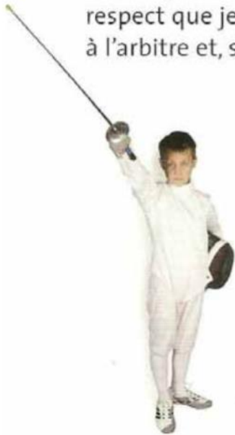
1 er temps , le fleuret est dirigé vers le ciel.

Il est obligatoire au début et à la fin de chaque assaut. C'est la marque de respect que je porte à mon adversaire, à l'arbitre et, s'il y en a, au public.