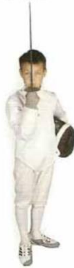
2 e temps , la coquille vient sous le menton.