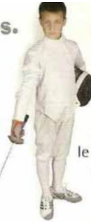
Position de départ , le fleuret est dirigé vers le sol.